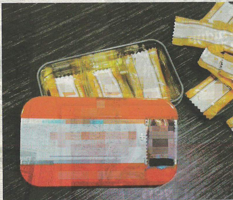
KKM merampas ubat perangsang seks, pelangsing badan dan pemutih kulit dalam 124 serbuan dengan nilai RM4.2 juta. – GAMBAR HIASAN

"Siasatan kes itu dijalankan mengikut Akta Racun 1952, Akta Jualan Dadah 1952 dan Peraturan Kawalan Dadah dan Kosmetik 1984," katanya ketika ditemui pada program Jelajah Scan, Sahih dan Selamat di Management & Science University (MSU), di